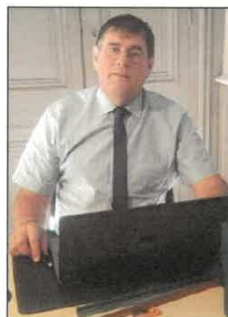
Le sénateur Patrick Chaize.